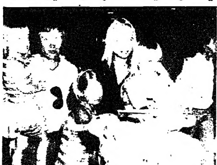
عائلة بريطانية هربت من الكويت الى السعودية لدى وصولها الى مطار فيثرو في لندن امس الاول

الاجانب، ٨٣ قيبليبييا و ٤٤ يوغوسلافيا و ٢٢ هنديا و ٢٠ بكنستانيا و ٢٢ من شيلي و ١٦ برازيليا و ١٥ تركيا و ١٥ فلانديا و ١١ كينيا و تسعة من سري لانكا و اندونيسي و غاني و بولندي و ارجنتيني و ياباني و مواطنين من جنوب افريقيا. وقال مصدر رسمي ان السفارة البريطانية في بغداد، ان عدد الرعايا الاجانب في الكويت هو ١١ امريكا و ١٤٤ سلحا ياباني و ٥٠ قيبليبييا و خمسة ديبلوماسيين من ألمانيا الشرقية. وعدد قليل من الاجانب من خارج اوروبا الغربية.